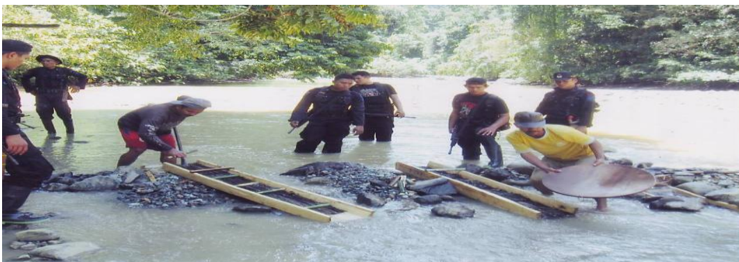
Gambar 3. Kegiatan pengamanan terhadap penambangan emas ilegal di S. Paguyaman

Perburuan liar merupakan ancaman terbesar bagi kelestarian populasi babirusa. Walaupun telah dilindungi undang-undang, kematian babirusa akibat perburuan liar masih sangat tinggi disebabkan oleh masih lemahnya penegakan hukum, tingginya perburuan dan perdagangan liar (Clayton et al. , 1997, Clayton and Milner-Gulland, 2000), deforestasi dan degradasi habitat, serta jumlah anak yang dilahirkan per kelahiran yang sedikit (Ito et al. , 2005, Ito et al. , 2008).