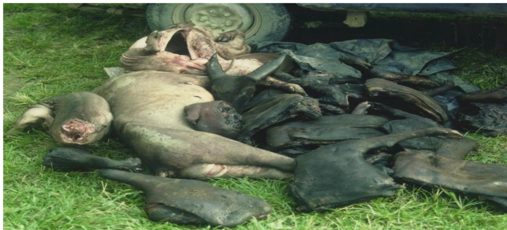
Gambar 4. Anoa dan Babirusa hasil kegiatan illegal